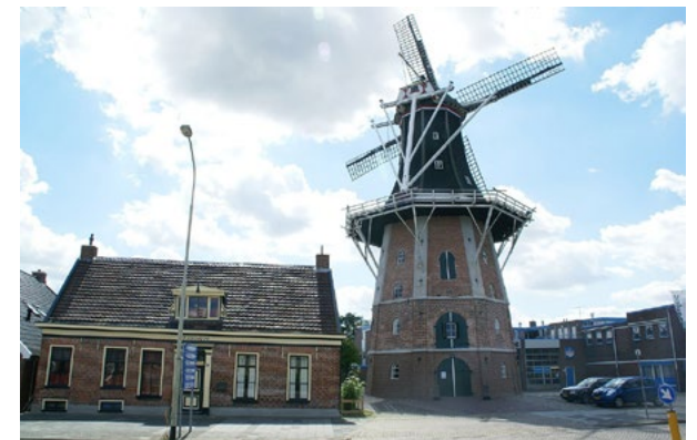
Winschoten, Molen Edens, de stelling is twee keer verhoogd (in 1870 en in 2006/2007) vanwege ontwikkelingen in de omgeving

Het omgevingsplan gaat over alle aspecten van de fysieke leefomgeving, zoals de bescherming van monumenten, waaronder de molens, het archeologiebeleid en de omgeving van de monumenten zoals de molenbiotoop.