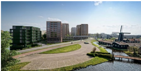
Nieuwbouwplannen bedreigen De Held Jozua in Zaanstad