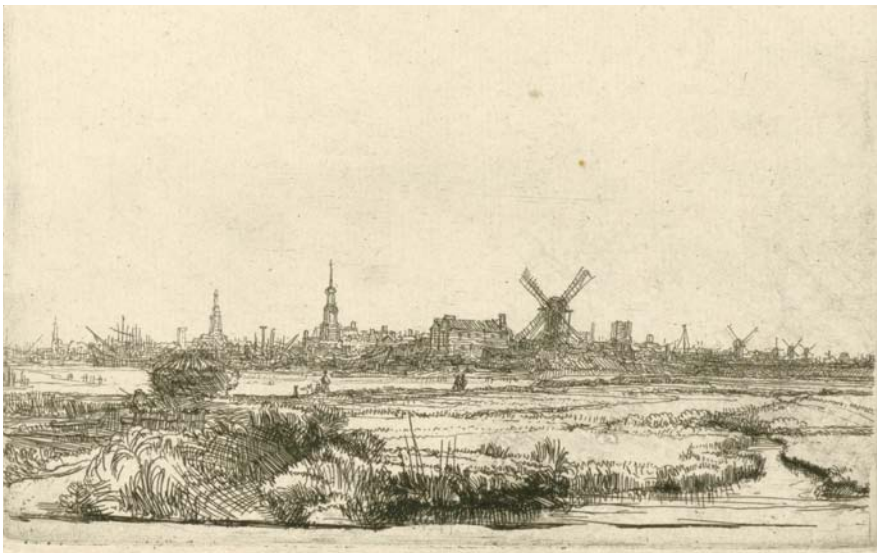
Ets 'Gezicht op Amsterdam vanuit het noordoosten', Rembrandt van Rijn, 1641.

1641 was een productief jaar. Rembrandt maakte een aantal portretten en brak door als vervaardiger van etsen. Hij maakte er ongeveer 290, waarvan 260 in bezit zijn van Museum Het Rembrandthuis in Amsterdam. Hij was een groot meester in de etskunst.