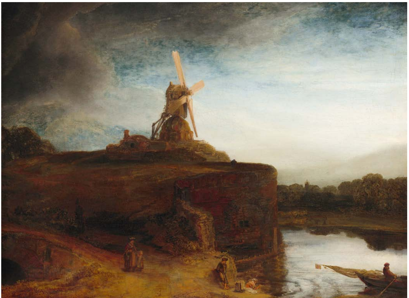
Schilderij 'Rivierlandschap met windmolen, Rembrandt van Rijn ca. 1646.

werd het gesloopt en de plaquette verhuisde naar de fabrieksmuur. Van deze actie had men in 1963 spijt. Er werd een imitatiegevel gemaakt. Na de sloop in 1980 is de gevelsteen ingemetseld in het nieuwbouwcomplex in de Weddesteeg. Toch is zijn geboortehuis sinds maart 2019 te bezichtigen. Erfgoed Leiden en Omstreken ontwikkelde namelijk een virtuele reconstructie van zijn geboortehuis en woonomgeving. (Zie: erfgoedleiden.nl/schatkamer/rembrandt .)